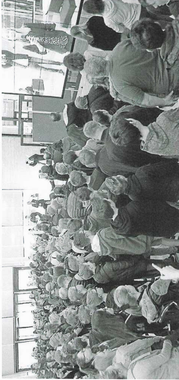
Massenaufmarsch beim länderübergreifenden „Tag der offenen Betriebstür“.